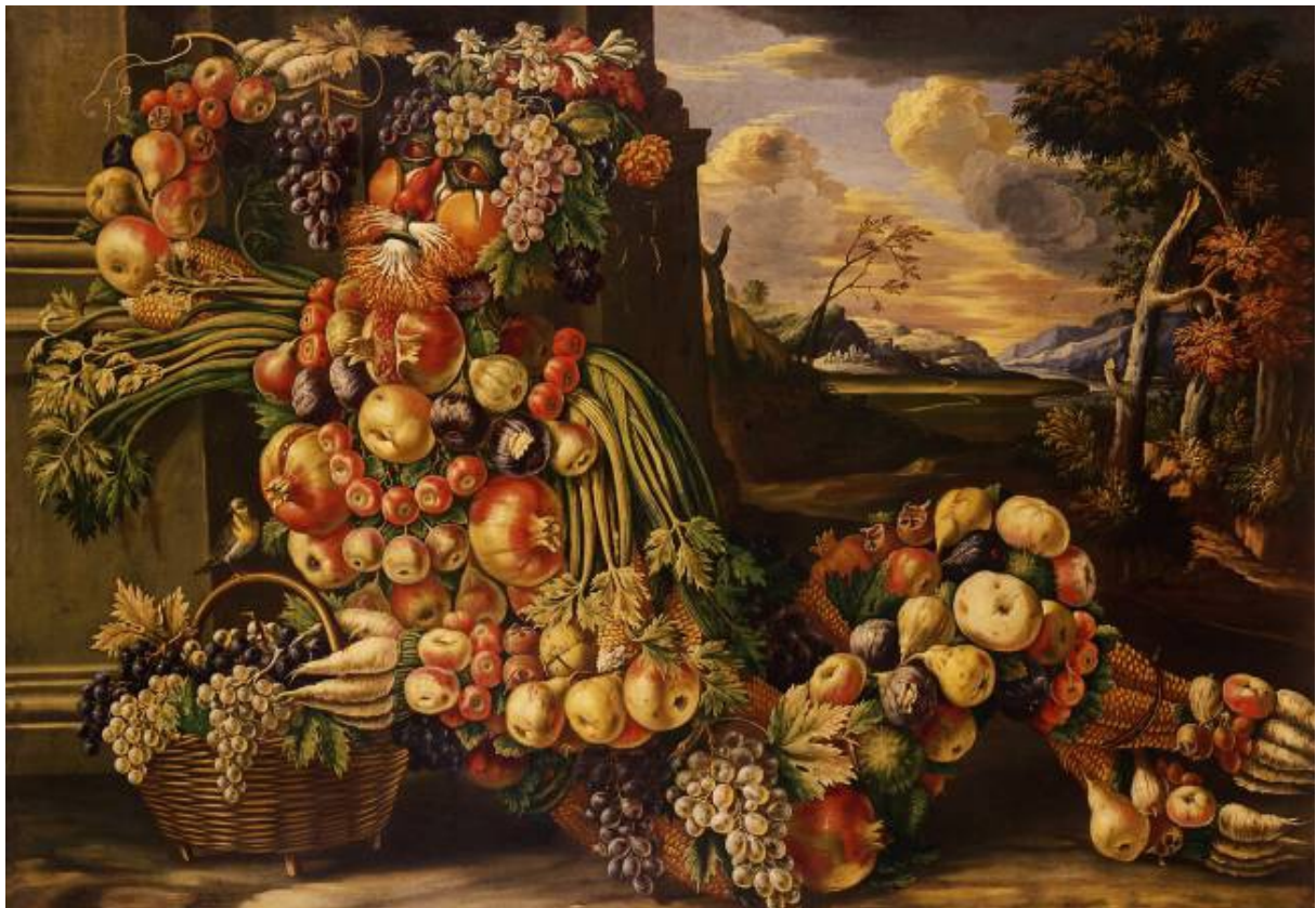
Giuseppe Arcimboldo, Figure assise de l'été