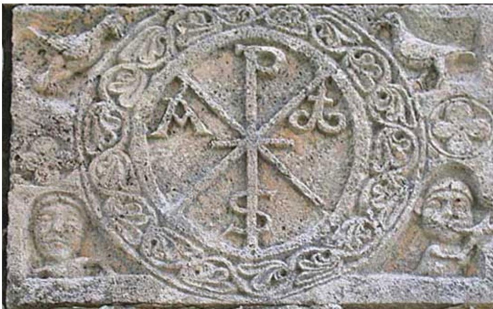
Christe, alpha et oméga, colombes. Eglise de Coll, vallée de Boï, Catalogne.